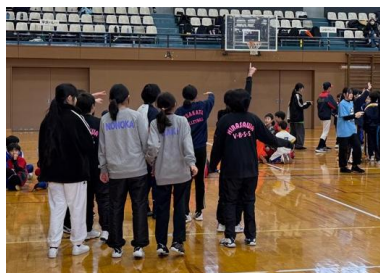
12月第1土曜日 象潟体育館