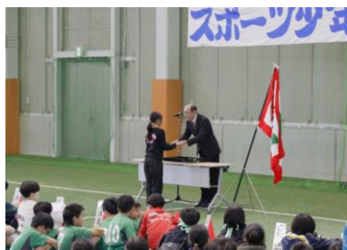
4月第3土曜日 エスパーク★にかほ