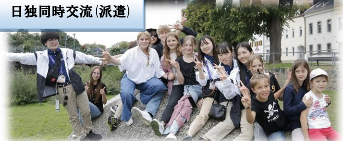
日独同時交流(派遣)