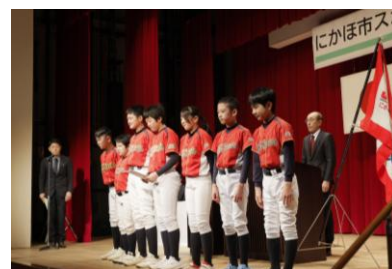
3月第1土曜日 仁賀保勤労青少年ホーム