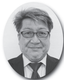
委 員 伊 藤 知