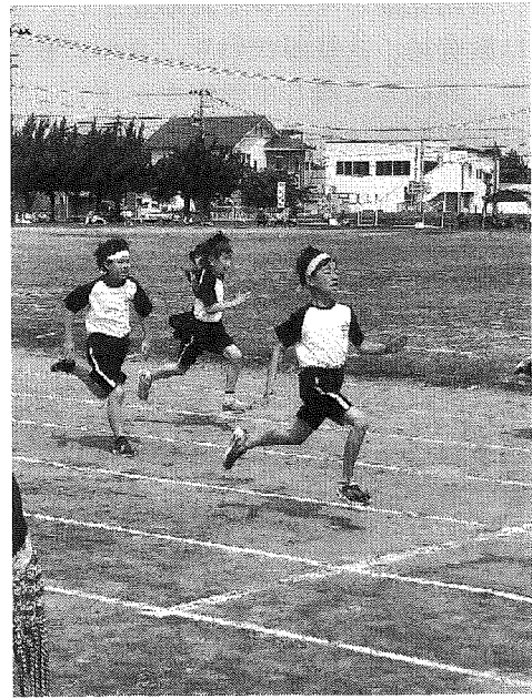
真剣なまなざしで勝負に挑む児童