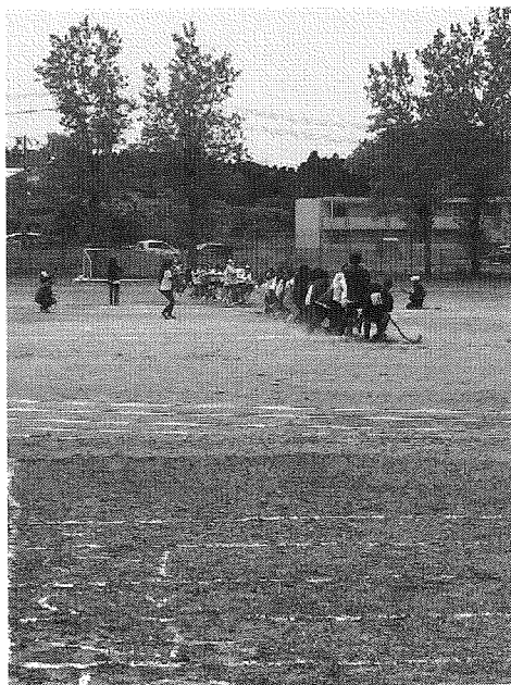
保護者が途中から参戦した綱引き