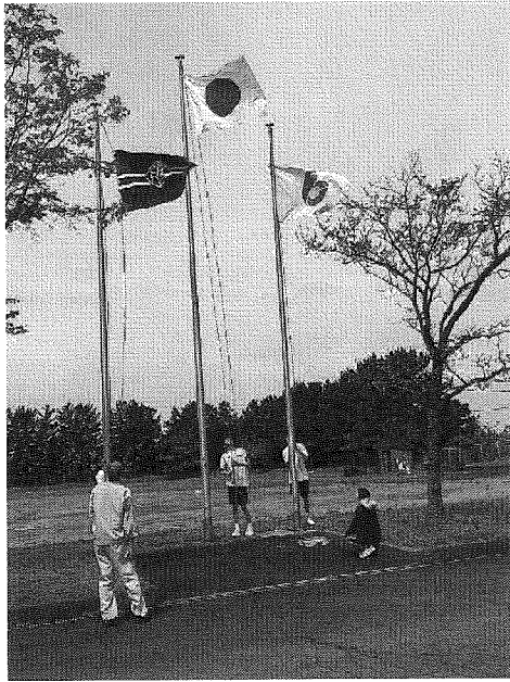
開会式で代表生徒が、旗を掲揚

4月13日に中学校、29日に小学校の運動会が開催されました。両日とも好天に恵まれ、多くの保護者が見守るなかで、児童・生徒の真剣なまなざしや笑顔、運営に奔走する教職員の頑張りを目の当たりにして、元気をもらいました。私の小中学校時代とはもちろん違いますが、時代の変遷のなかで、競技種目の工夫と改善に感心しました。一例を挙げますと、競技開始直後は、児童同士が綱引きをしているのですが、途中から保護者が駆けつけ児童の後方で綱引きに加わり、混合で勝負を決するという綱引き競技を見せてもらいました。保護者も童心にかえって、必死に綱を引き、子どもたちも大声で応援するという風景に魅了されました。