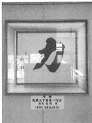
象湯体育館内に 飾られた色紙！ 第33代立行司 木村庄之助 書