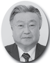
教 育 長