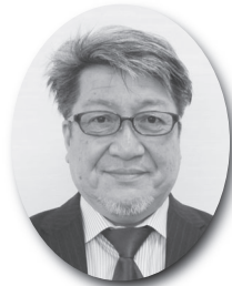
職 務 代 理 者