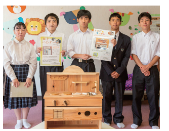
▲ゆり支援学校の生徒

6月1日、ゆり支援学校から金浦公民館(こどものえき)へままごとキッチンが寄贈されました。これは、当館を利用する子どもたちに使ってもらいたいと寄贈されたもので、今後子どもたちの健全な育成のために使われていきます。