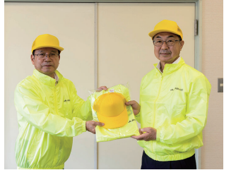
▲兼松常務理事(右)と教育長