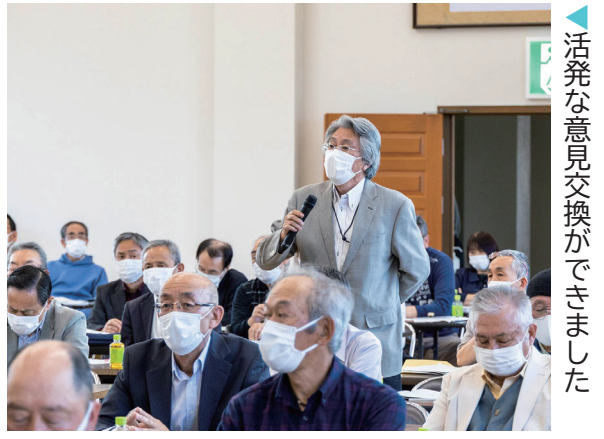
活発な意見交換ができました

5月23日、象潟公民館で行政懇談会が開催されました。市当局と各自治会長が一堂に会する当懇談会。当局から主要事業などの説明が行われたほか、自治会長からは質問や要望が出され、地域と行政が協働で知恵を出し合う貴重な意見交換の場となりました。