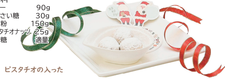
ピスタチオの入った