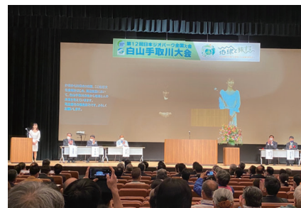
▲白山手取川で行われた全国大会の様子

地の魅力」をお客さんに楽しくわかりやすく伝えることです。とは言え、「ジオパークって何だか難しそう」というイメージがあることも現実です。ジオパークをすべてのお客さんに楽しんでもらうためには、私たちガイドがこの地域の魅力をさらに深掘することが必要です。伝えたい地域の宝を地域の皆さんとジオガイドが連携して学び合い、共通課題を探し課題解決を共に考え、全国大会のようにお互いが元気になれる関係作りを実現することがジオパークの存在意義だと思っています。