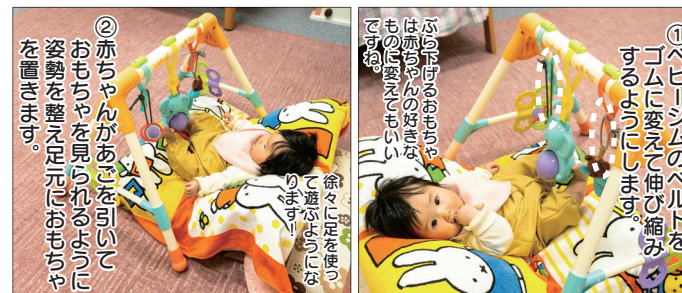
モデルは足上げ遊びが上手なゆのちゃん。次回も続きます♪

ねんね期やころころ寝返り期の赤ちゃんにおすすめのおもちゃを2回にわたり紹介します。今回は寝返りを促すおもちゃの使い方です。寝返りには足先を上げるようになることが大切です。姿勢を整え、赤ちゃんのじっと見る力を引き出します。どんどん足上げて遊ぶようになりますよ。