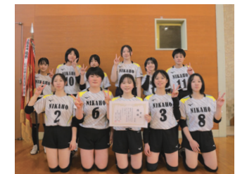
仁賀保中学校バレーボール部