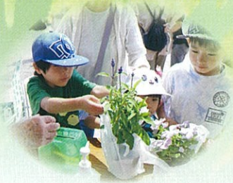
森林祭での募金活動