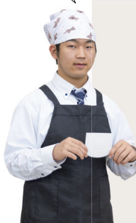
レシピ・撮影協力：仁賀保高等学校クッキングクラブ（NCC）