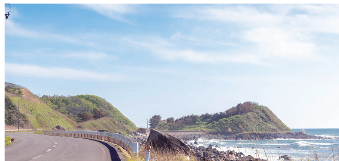
激烈な励ましの超過激な向かい風を味わえる飛のくずれ付近のコース

ごと、イベントにも関わらせていただき、観光協会職員の方々とどう工夫すればお客さまが増えるだろうか? インバウンドも増やしていきたい! など、いろいろな議論ができました。