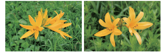
▲鳥海山のニッコウキスゲ ▲飛島のトビシマカンゾウ

解析を行っています。これまでの葉緑体DNAを中心に調べた結果だと、トビシマカンゾウの葉緑体型は鳥海山のニッコウキスゲとは違っており、秋田県の男鹿半島や宮城県の大森半島のニッコウキスゲと同じでした。飛島以外で唯一のトビシマカンゾウ自生地の佐渡島のものとも同じでした。となると、トビシマカンゾウの葉緑体型は鳥海山にはないものの、東北、佐渡に広く分布していることになり、起源はどこなのだろう、とさらなる疑問がわきます。研究は現在も続いているので、今後トビシマカンゾウの起源が解明されたらまたこのコラムで紹介します。