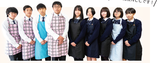
わたしたち 仁賀保高校NCCです!

アフリカの食材とにかほ市で生産している食材を掛け合わせたスイーツを開発します。取り組むのは仁賀保高校クッキングクラブ (NCC) の皆さんで、世界各国・郷土料理研究家のオンライン研修を受講して進めます。スポーツ選手も癒されるスイーツを期待しています。