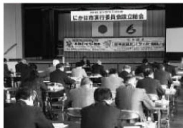
秋田わか杉国体にかほ市実行委員会組織図