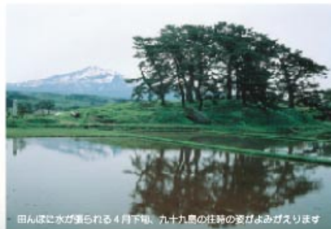
田んぼに水が張られる4月下旬、九十九島の住跡の姿がよみがえります

私たちのふるさとを特徴づけている特産品。長い歴史のなかで生まれ育まれ、今日まで守り伝えられてきた文化財。そんな「まちのたから」の数々をシリーズで紹介しています。