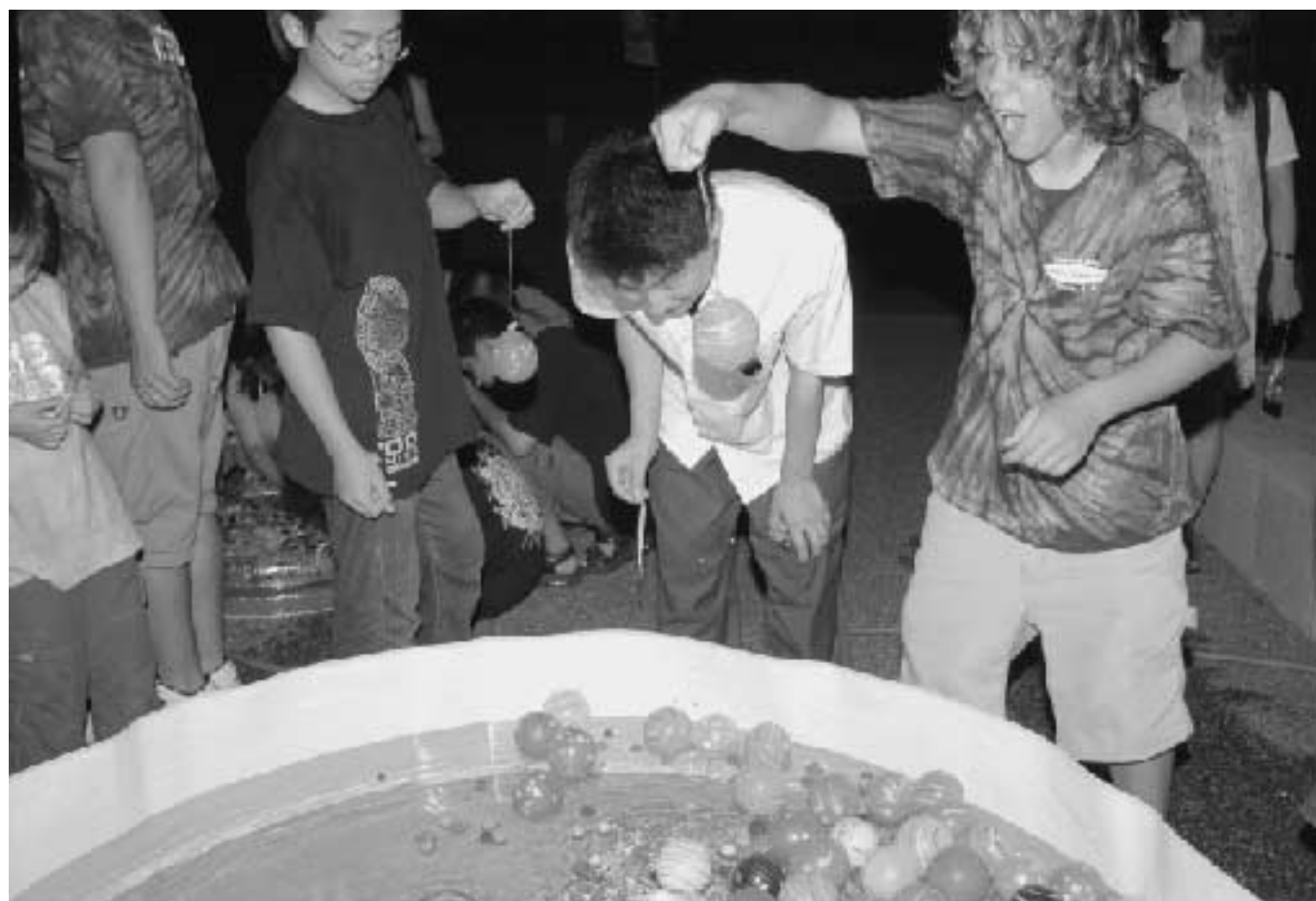
(7月30日、日米子供交流・ ウエルカムパーティー/ねむの丘) = 関連記事3ページ =

news ようこそ象潟へ ～諸賀市・アナコーテス市から訪問団～ 九十九島の美景を守りましょう 夏バテを防いで夏を乗り切ろう！ みんなの夏休みをウオッチング