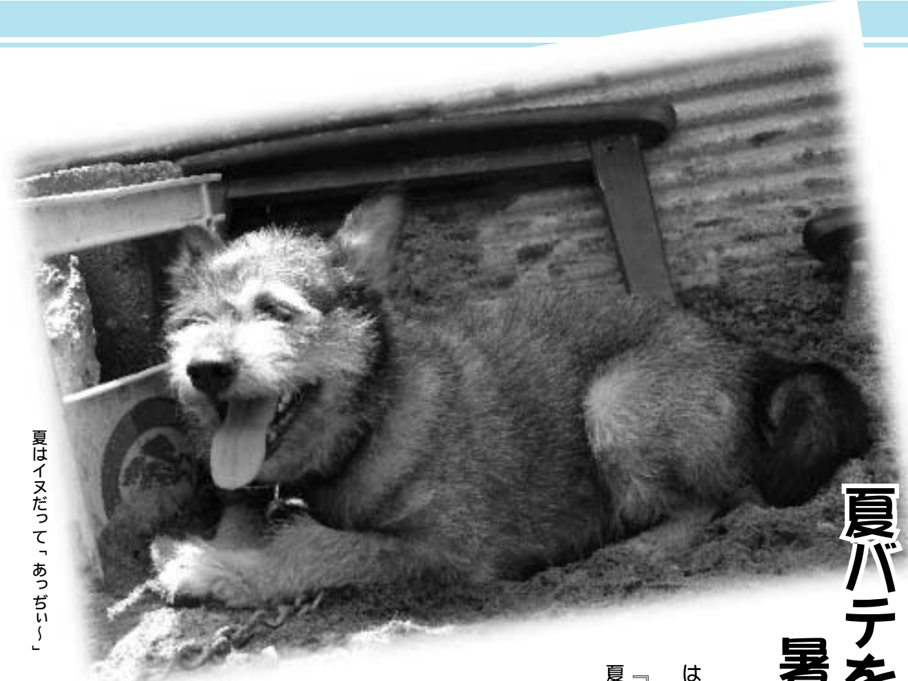
夏はイヌだって「あつぢい」

いよいよ夏本番、外は蒸し暑く、建物や家の中では冷房。体はギフアツツしていませんか？ 「疲れがとれない」「食欲がない」「だるい」……これらは「夏バテ」の症状です。夏バテはある程度防ぐことができます。夏バテを上手に防いで、楽しい夏を過ごしましょう。