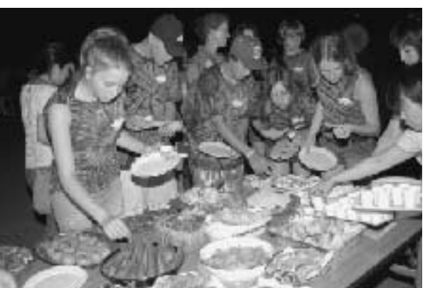
国際交流協会、ホストファミリーらが持ち寄った料理でもてなしました

日米子供交流事業 アナコーテス市から21人が到着 7月30日から、姉妹都市アナコーテス市の中学生16人と引率者5人の計21人が本町を訪れています。本町に到着したこの日は、ねむの丘で縁日風の歓迎パーティーが開かれ、この夏一番の暑さの中、生徒たちは縁日の雰囲気の中でパーティーを楽しみました。 本交流事業で、アナコーテス市の子どもたちを本町への受け入れるのは5回目。訪問団は8月9日までの間、ホームステイをしながら本町で開催される各種イベントなどに参加し、交流を深めます。