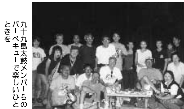
九十九島太鼓メンパールのバーベキューで楽しいひとときを

輪を大きく広げていってほしい。私たちはみんな家族のようなものです。いつまでもこの関係を続けていきたい」と話してくださいました。 また、スコット氏は「象潟町とアナコーテス市は理想的な関係を築いています。世界中でこのような関係を持つことができれば、平和な世界を築き上げることができるといいでしょう。子どもたちにはそのリーダー的な存在になってももらえると嬉しいですね」とメッセージをいただきました。 二人は7月21日から27日まで滞在し、新しい思い出をつくり、本町から多くの町民がアナコーテス市を訪問してくれることを願っていました。