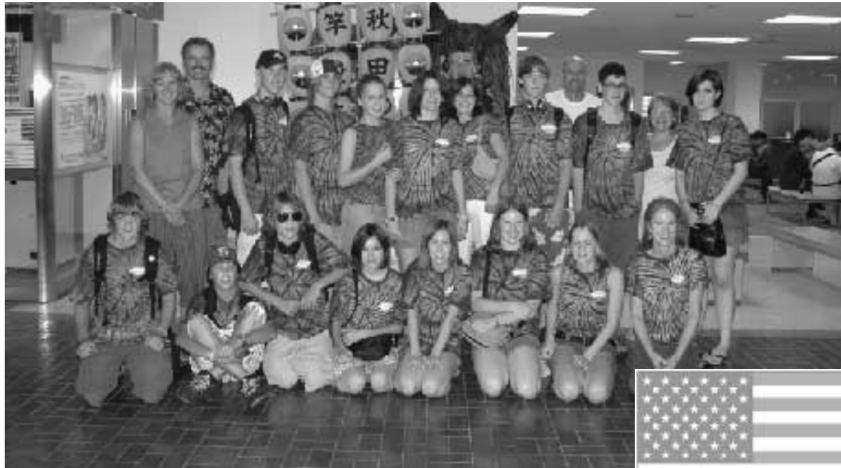
30日、秋田空港に無事到着。長旅の疲れも見られなく、元気いっぱいです。

7月は、本町の友好都市関係にある中国・諸暨市、米国・アナコーテス市からの訪問が相次ぎました。それぞれに新しい思い出をつくり、これまで以上にきずなを深め、さらなる各市町間同士の発展が期待されます。