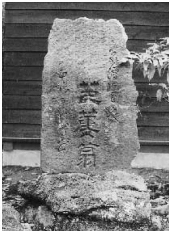
蛸満寺にある芭蕉句碑が象潟地震で倒れ、まっ二つ割れ、その跡が残っている。後の新潟地震でもまた倒れて同じところが