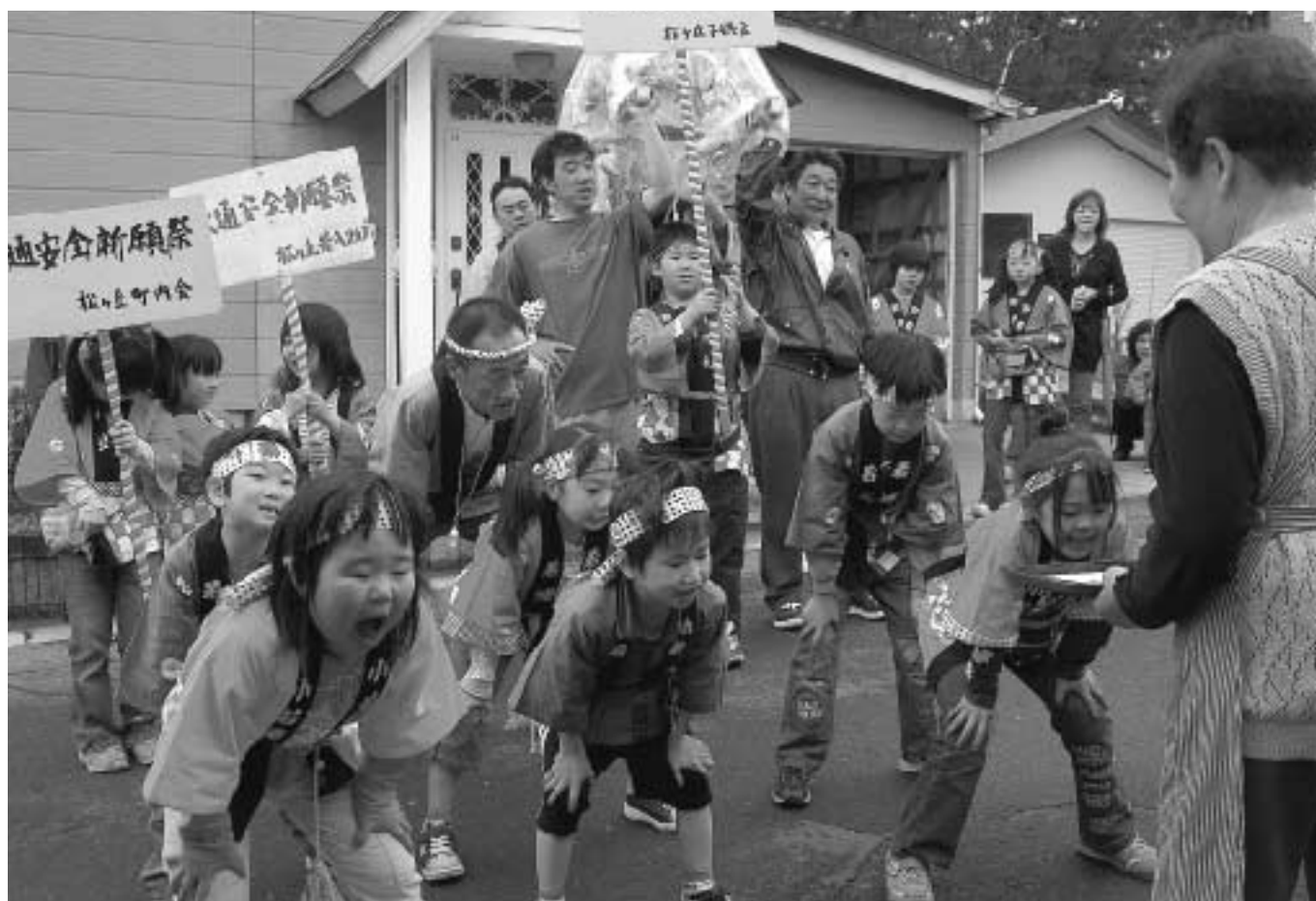
(5月16日、交通安全祈願祭〈松ヶ丘町内会〉)