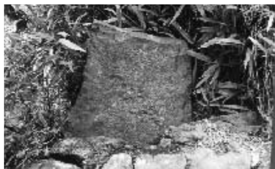
象潟地震で小滝地区が陥没したことを伝える石碑（小滝）