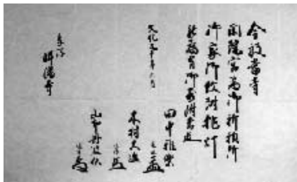
「閑院宮家の墨付」（蛸満寺蔵）