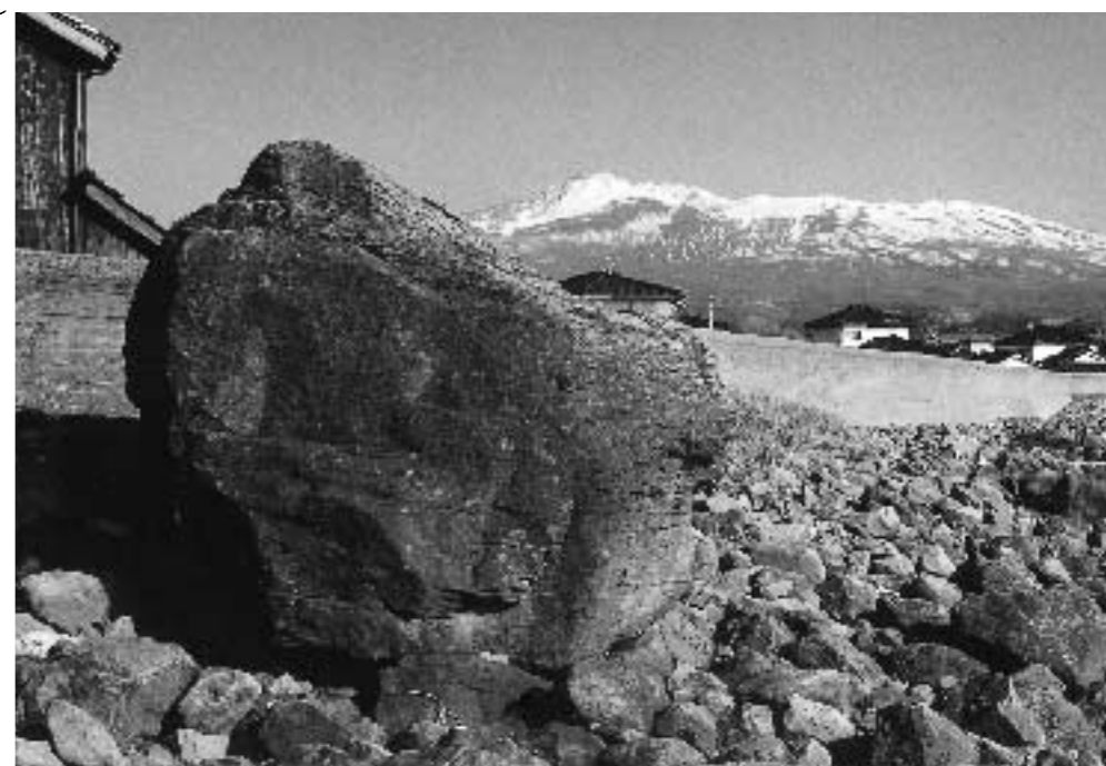
地震で地盤が隆起したことを示す唐戸石