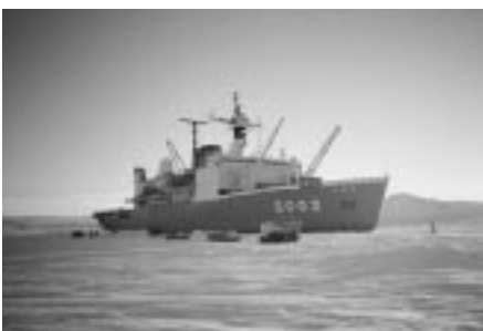
南極観測船「しらせ」

詳しくは、国立局地研究所のホームページをご覧ください。 ( http://www.nipr.ac.jp/japan/index.html )