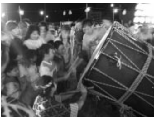
竿灯太鼓の体験 おっきいなあ～

今回の湾頭まつりでは、町内の企業、個人の方々からたくさんの方々の協賛金をいただきました。ありがとうございました。