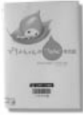
「ぴちよんくん」 石原真由美 / 監 明日香出版社編集部 / 編

あの人気キャラクターが英語の本になりました。「スクラブ入りの洗顔料は気持ちいい」「ついでにマヨネーズ持ってきて」など、本当に普段の生活で言いたいことがぎゅっしり！