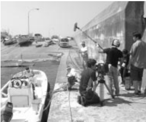
本場仕込みの漁師の演技! (上架場での撮影風景)