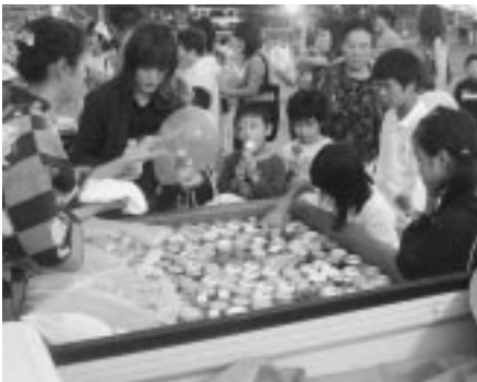
ジュースちょうだい!

強風のため、竿灯が前後左右に大きく揺れ、演技者もバランスを取るのになりに苦心しているようでしたが、その揺れが迫力となり、ひときわ大きな歓声が上がっていました。