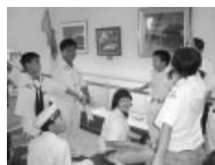
手旗信号でコミュニケーション