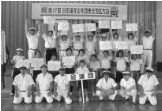
金浦海洋少年団のメンバー