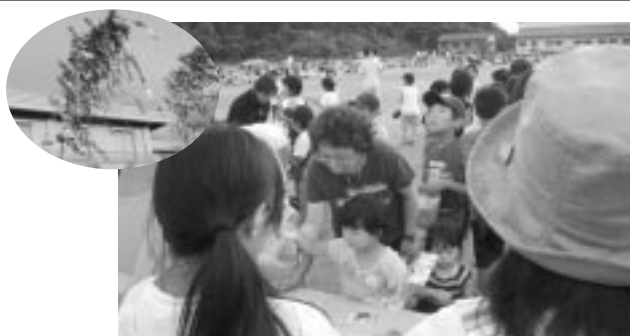
ねえねえ、このおもちゃ買おう~

午後6時からはおもちゃ店、 アイスクリーム、水ヨーヨーな ど、児童らによる出店がオーブ ンし父兄らも交えて大いに賑わ っていました。