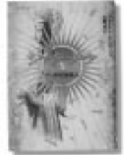
「王子シッタールタ」 - プッダの微笑み - パトリチア・ケンディ / 著 大岡玲 / 訳 集英社 / 編

誰もがオフクロに小言を言わねながら育ってきた。考えに沈んだり、思い屈したり、そんな時、なんとはなしに思い出すオフクロの声。ちよっとしたことの中にこめられた人生万般に通じる哲学を綴る。