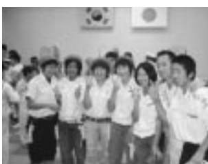
交流会セレモニーにて

また、あいにくのお天気の中、雨に濡れながらも海で行った力又ー体験や乗船体験ではみんな大ハシヤギ！国境を越えた笑顔の絶えない交流会でした。