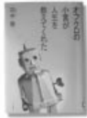
「オフクロの小言が 人生を教えてくれた」 向井徹 / 著 PHP研究所 / 編