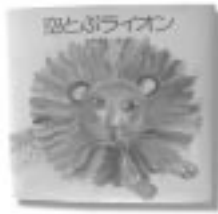
「空とぶライオン」 佐野洋子 / 著・絵 講談社 / 編

シャカ国の王子として生まれたシッタールタは、王子に敵意を持つデーヴァタッタとの確執、絶世の美女ナーラーヤニの誘惑などと戦いながら、天命を果たすことを決意。 王宮での生活を捨てて、修行の旅に出る。