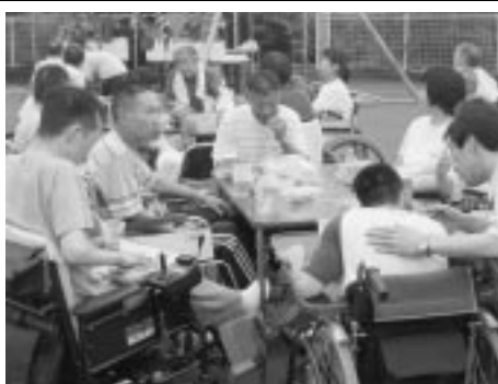
おいしい食べ物に会話も弾んだ 楽しいひととき