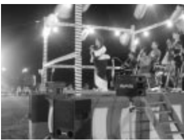
梅若芸能企画による歌謡・民謡ショー

会場の周りには漁協、JA、商工会などから多くの店が出店され、食べ物や飲み物などを買いたい求める人たちが溢れていました。家族連れや帰省中の人たちなど約3,500人の人出がありました。