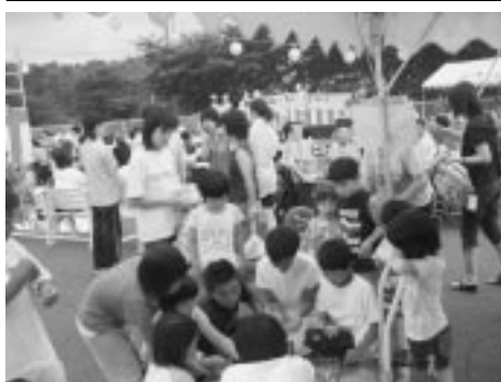
おもちゃ、ゲームに子供たちも 大はしゃぎ!!

8月6日(金)、午後5時30 分から浩寿苑夏まつりが開催さ れました。金浦神楽、踊りなど が披露され、施設を利用して いる皆さんや、そのご家族など約 340人が夏の夜のひとときを 楽しく過ごしました。