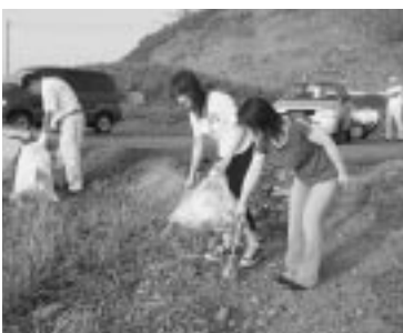
秋田銀行経友会のみなさん

7月28日、秋田銀行経友会のみなさん15名が、飛のくずれのクリーンアップを行いました。この時期、飛のくずれはキャンプを楽しむ人達で賑わいます。