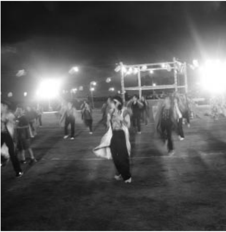
よさこいソーラン

メンバーのみなさんは、この日のために一生懸命練習してきました。7時からは、梅若芸能企画一行による歌謡・民謡ショーが行