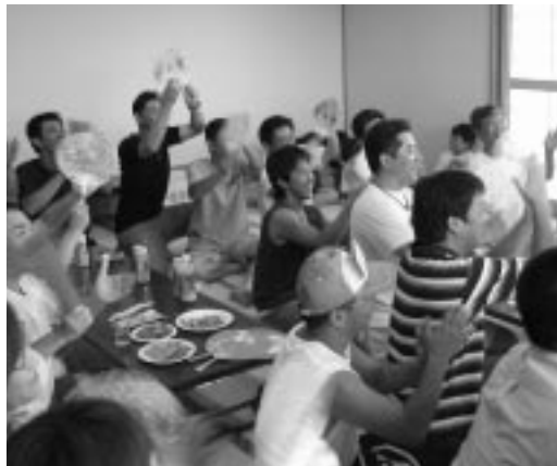
拍手? 歓声? ま・まさか! (「エニワン」での撮影)