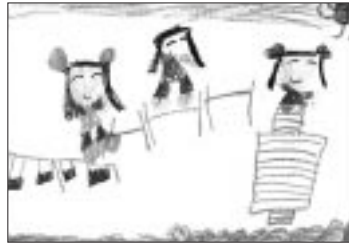
「鉄棒であそんでいるところ」

ママごと、折り紙、絵をかくことがとっても大好き。最近は、お手伝いもよくしてくれます。