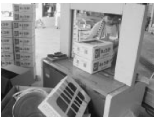
農作物の出荷作業

今回は、地産地消というテーマを通して記事としましたが、これに限定せず、これをきっかけにして「食」について考え、そしてより一層、食事を楽しんでほしいと思います。