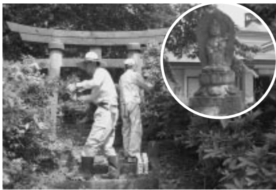
暑い中、ごくろうさまです。