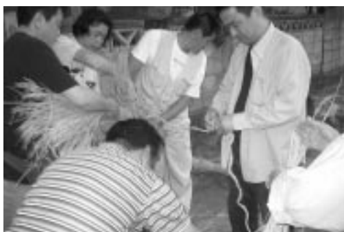
大蛇を作ってるところ・・・