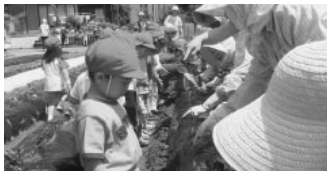
これって、いつおイモになるの？