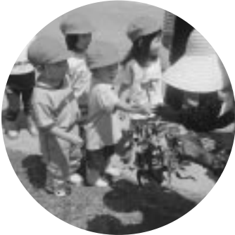
ぼくにもちょうだい!! ^^

先生の言うことをきちんと聞いて、一列に並び、一人ひとりサツマイモの苗を手に取ります。さあ、いよいよ苗植えの始まりです。順番に畑に入り、みんな一生懸命に植えています。