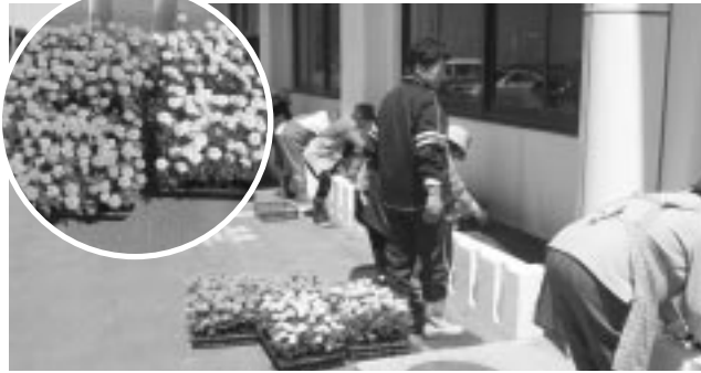
婦人団体連絡協議会のみなさん