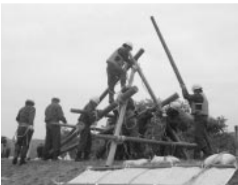
競技は真剣そのもの!! ほんとうにお疲れさまでした。

訓練を兼ねつつ作業時間と完成度を競う大会でもありますが、参加した団員は災害時と同様に緊張感を持ちながら作業に取り組んでいました。