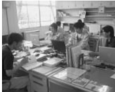
熱量変更準備作業