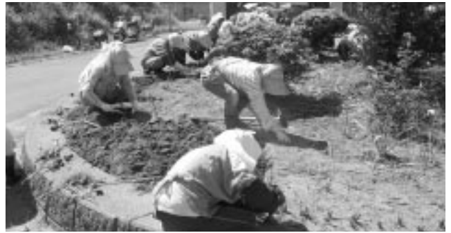
老人クラブ連合会のみなさん