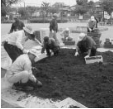
T D K 社友会有志のみなさん