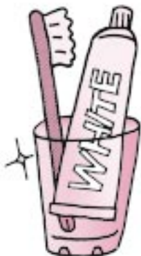
本荘市由利郡歯科医師会

日時 7月12日(月)9:00~11:30 場所 保健センター 対象 乳幼児とその家族 健康づくりや介護に関することなど、保健師による相談会です。どなたでもお越しください。