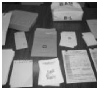
統計資料の数々!! 資料が多すぎて・・・ カメラに入りません^^

それから、今年は統計の当たり年。今、まさに作業の真っ最中です。来年の国勢調査の準備もあるし・・・私も初めてなので勉強奮闘中！