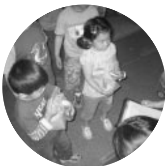
どうもありがとう! なにがはってるのかなあ^^ (最後にお菓子をもらったよ)

逃げるのだそうです。)その後、切れた縄を集め、大蛇を作って、とぐるを巻かせます。このとぐるの上に子供たちを順番に乗せ、大人たちが「ドントッキドン」と掛け声をかけて胴上げをします。最後に、とぐるを解いた大蛇を子供たち全員で運び、地区で祈りをします。子供たちの健康と幸せを願って・・・