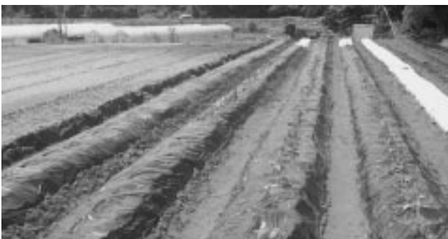
みんなが、植えたサツマイモ畑 がんばりました。