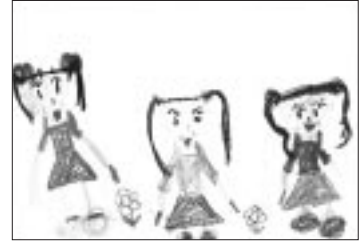
「おえかきしているところ」

お絵描き、ぬりえ、絵本が大好き！毎日、けんかしながらも妹の面倒をよくみてくれます。ちょっぴり甘えん坊で笑顔のかわいい女の子です。