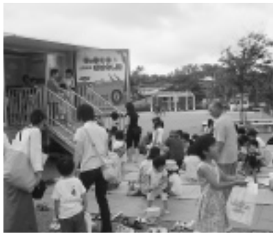
キャラバンカーを前に.....