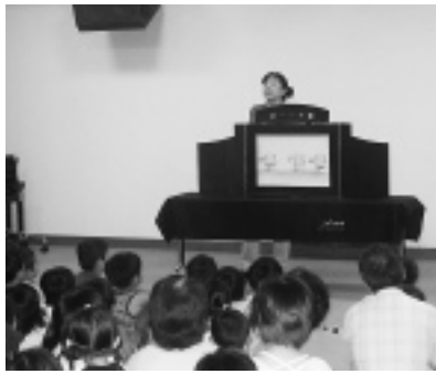
「こびあ」ハイビジョンルーム でのおはなし会の様子

子どもたちは、手あそびうた や絵本の読み聞かせに夢中で、 「猫が家にやって来るといってお 話しの紙芝居」では、「カメレ オンみたいな猫だったどうしよ