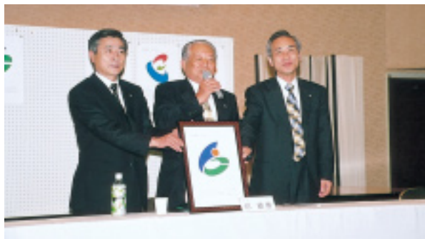
決定した瞬間、市章を手にする3町長

7月15日、第25回仁賀保町・金浦町・象潟町合併協議会が、金浦町勤労青少年ホームで開催され、「町名、字名の取扱い」など4件を報告また、「新市の市章について」協議がなされました。