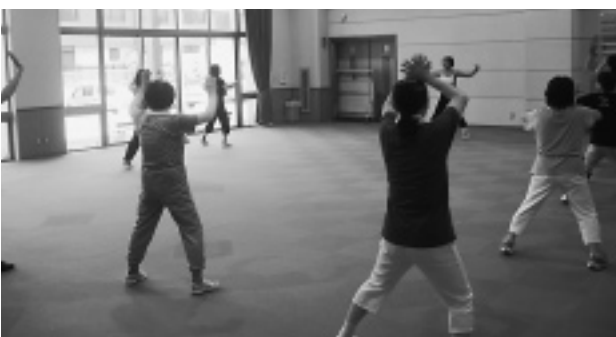
エアロビクス教室の様子

子どもがいる方は託児もできますし、血圧測定と体脂肪測定も実施していますので、健康管理にも一役……。どなたでも無料で、気軽に参加することができます。