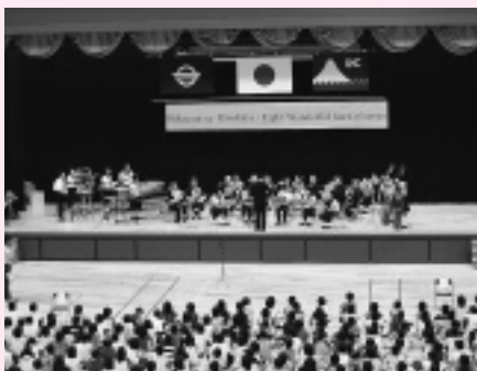
アウトリーチミニコンサートの様子

コンサートには金浦町、象潟町、仁賀保町の各小中学校の生徒らが招待され、また吹奏楽部の生徒たちには奏者らとの共演という素晴らしいプレゼントが用意されていました。