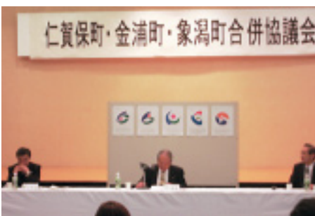
市章の選考方法について委員らに意見を求める巴仁賀保町長

次回の協議会は9月中の開催を予定しておりますが、これをもって協議会は廃止される予定です。