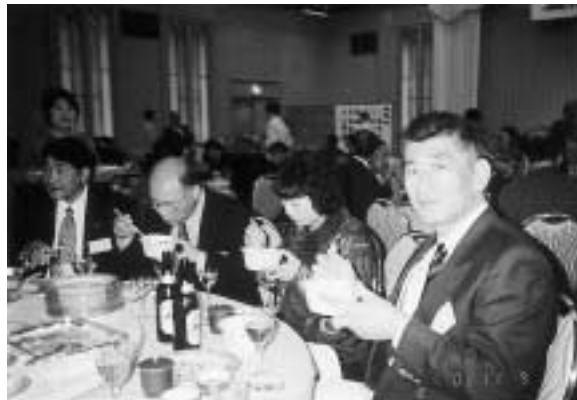
好評の「八タ八タ汁」

また、今回も生まれ故郷金浦の特産品をJA、商工会の職員が直接会場に向かい販売しており、出席した会員から大変喜ばれました。