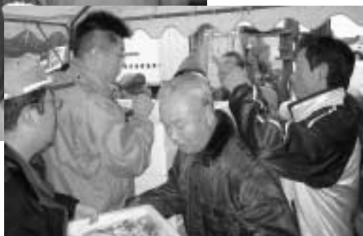
売り切れ続出、ハタハタ大人気