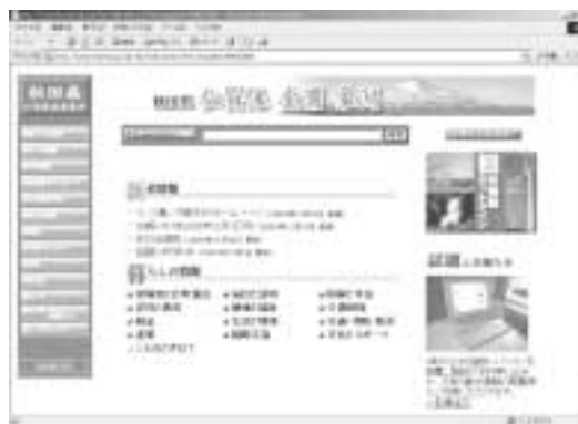
ホームページ・アドレス http://www.nkktown.jp

そんなとき、ホームページ上か ら委任状や郵便請求用の申請書用 紙等を入手することができます。