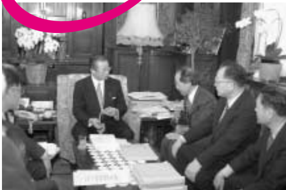
南極観測継続を求める小・中学生の手紙が河村文部科学相へ = 文部科学省 (12月2日)