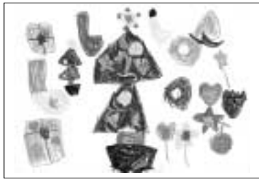
「クリスマス・パーティ」

弟をかわいがってくれる優しいお姉ちゃんです。いつも元気いっぱい楽しんでそうなのはお菓子パワーのせい...?!