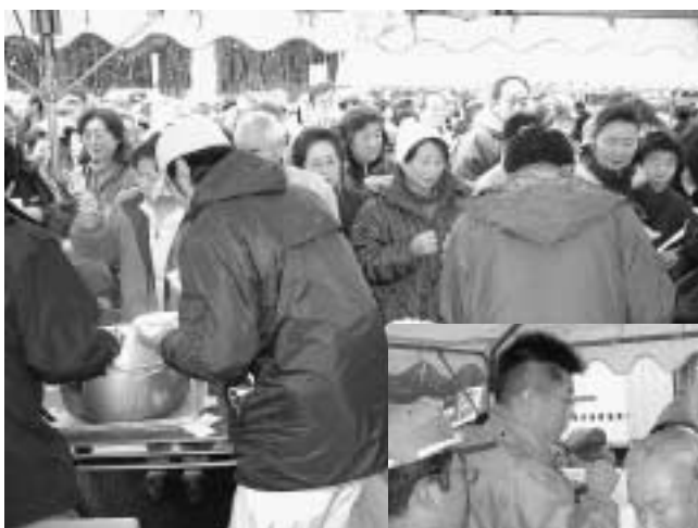
順番が待ち遠しい ハタハタ汁

ときおり雨風が激しくなるといって天気でしたが、ハタハタ汁も約2時間で800杯が完売。冷たい身体を暖める1杯になりました。