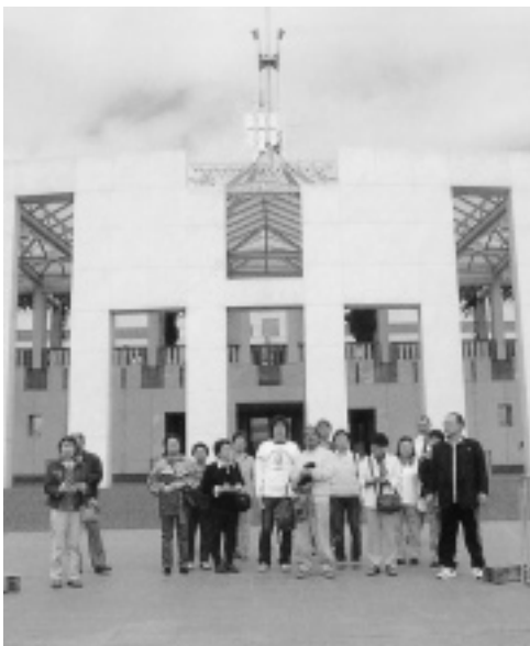
オーストラリア国会議事堂前にて