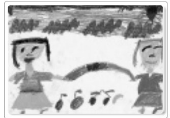
「縄跳びしているところ」

身体は小さいけれど、3姉妹の末っ子パワーを毎日発揮しています。今は、縄跳びを楽しんでいます。