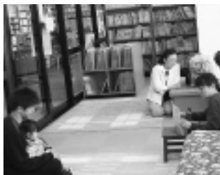
楽しい催し物がいっぱいだよ