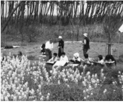
会場は、菜の花一色 (親子写真会)

5月1日、赤石浜海水浴場 緑地広場で、「菜の花まつり」が開催されました。 これは、オランの会(仁賀保バイオマス利用促進会)が主催して行ったもので、BDFの精製実験、BDF燃料車の走行実験のほか、親子写真会、琴・尺八などによるミニコンサート、写真撮影会などが催され、また参加者には薪ストーブで作ったとん汁もサービスされました。