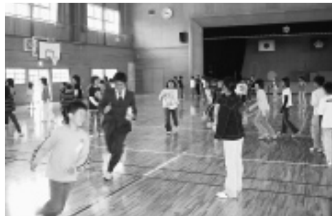
浜っ子運動タイム（金浦小学校にて）