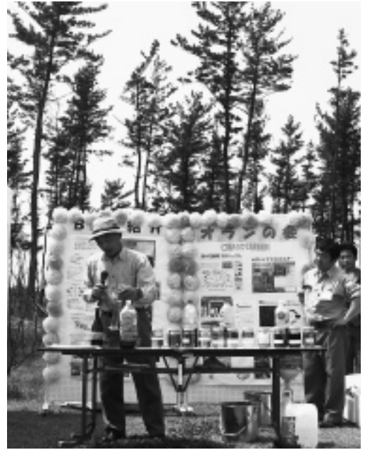
BDF(バイオ・ディーゼル・フューエル)の精製実験 廃棄物として処分されている「廃食用油」を回収し、それを精製して、ディーゼル燃料や発電機燃料などに再加工されたもの。

5月1日、赤石浜海水浴場 緑地広場で、「菜の花まつり」が開催されました。 これは、オランの会(仁賀保バイオマス利用促進会)が主催して行ったもので、BDFの精製実験、BDF燃料車の走行実験のほか、親子写真会、琴・尺八などによるミニコンサート、写真撮影会などが催され、また参加者には薪ストーブで作ったとん汁もサービスされました。