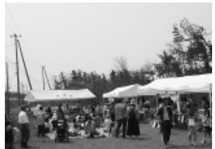
会場となった赤石浜海水浴場 緑地広場 (天気にも恵まれ、多くの来場者で賑わいました)

今後の予定 6月下旬 菜の花の刈り取り 7月上旬 採取、残りの茎葉の堆肥化 8月初旬 搾油、天ぷら試食会 9月初旬 整地作業、種まき "下旬 体験発表会 ポランティアを募集しています。 詳しくは、(32)4071 オランの会へ