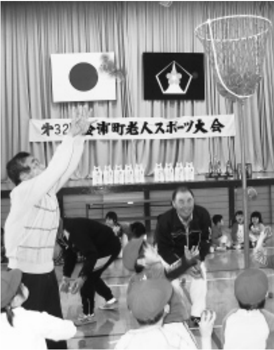
第32回老人スポーツ大会（勢至保育園児たちと一緒に）

金浦町のチャレンジデーへの参加は、2002年（4年前）の町制施行100周年を記念して始まったもので、今回も町民、町内企業、各団体から多数の参加がありました。