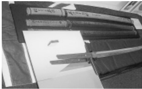
白瀬中尉がデービッド教授に贈った日本刀（オーストラリア博物館にて）