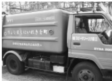
バイオディーゼル燃料使用車