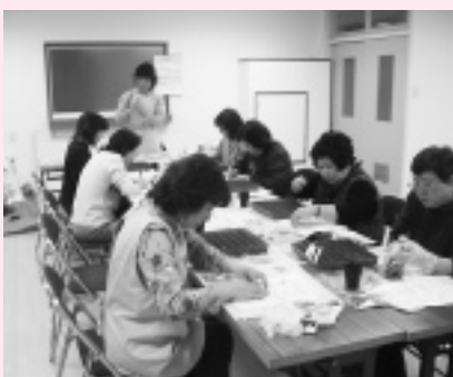
ガーデニング教室の様子