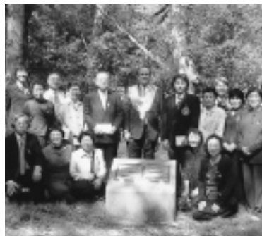
記念碑前にて(ウラーラ市長と)

これからは地元の人達と一緒に白瀬陸軍中尉の偉大さを後世に語り継がなければならぬものと感ずるとともに、とても貴重な経験と強い感動を与えていただいた研修にあらためて感謝申し上げます。