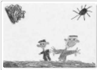
「太陽と遊んでいるところ」

料理が大好きで、サラダを作ったり、ホットケーキを焼いたりします。弟の世話もちゃんとみてくれて、頼もしいお兄さんです。