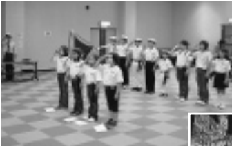
第37期金浦海洋少年団入団式