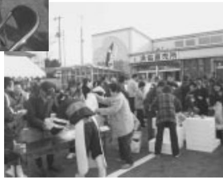
ハタハタの箱が飛ぶように売れました

次々と運ばれるハタハタの箱が飛ぶように売れていました。今回のフェアでは、町内外から大勢の方々が訪れその味を堪能し、冷えた身体を暖めました。