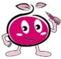
2005年農林業センサスマスコットキャラクター「つつちー」

調査の実施においては、調査員がご自宅へ調査票をお持ちいたしますので、調査へのご協力をよろしくお願いいたします。