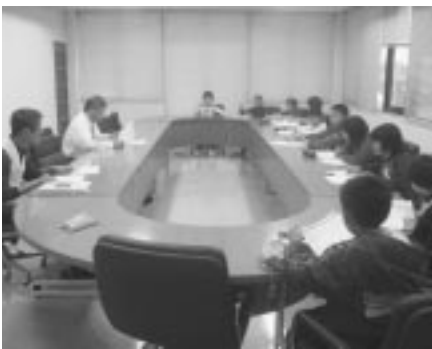
熱心にノートを取る小学生児童ら

役場を訪れた児童らは、「川の水は10〜20年前に比べてきれいになってきているのか?」「ゴミを捨てられないためにどんな工夫をしているのか?」「下水の処理はどうなっているのか?」などと質問し、配られた資料や、職員の説明に熱心に耳を傾け、一生懸命ノートを取っていました。