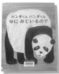
「パンダくんパンダくんなにみているの？」 エリック・カール / 絵 ビル・マーチン / 文館成社

政略結婚、駆け落ち、尼僧の恋、新興宗教入信…。宮廷女性たちの知られざる波瀾の人生とは？皇室ジャーナリストの第一人者が独自の視点で綴るせつない愛の物語。