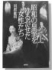
「昭和の皇室をゆるがせた女性たち」 河原敏明 / 著 講談社

ありえない男たちをめぐる恋愛小説。 “そもそも範疇外、ありえない、いいひとだけど、恋愛関係には絶対ならない” 男たちをめぐる最新恋愛小説。