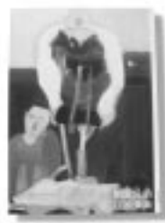
「間宮兄弟」 江國香織 / 著 PHP研究所

不登校、非行、リストカット、薬物乱用…。子どもは、大人たちは何を求めているのか？ 大人は、子どもたちに一体何ができるのか？13年間の夜回りで見つけた、たったひとつの答え。