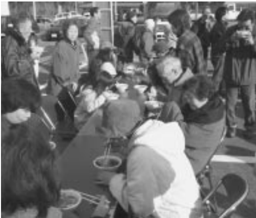
あったかくて美味しいよ！