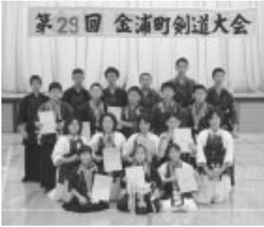
金浦町のちびっ子剣士たち