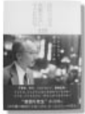
「夜回り先生と夜眠れない子どもたち」 水谷修 / 著 サンクチュアリ・パブリッシング

不登校、非行、リストカット、薬物乱用…。子どもは、大人たちは何を求めているのか？ 大人は、子どもたちに一体何ができるのか？13年間の夜回りで見つけた、たったひとつの答え。