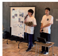
クリエイターズマーケット

移住してから東京では体験出来ない山菜採りや農業・漁業等のお手伝いを通して、地元の方の温かみに触れることができました。このような体験を首都圏に住む観光客の皆さんに提供したいと思い、にかほ市の生産者さんのお仕事のお手伝いや地元ならではの食事作法、宿泊体験ができるゲストハウスを作っています。そのため11月のオープンを目指し、横岡地区にある空き家の改修を進めているところです。