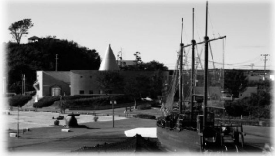
南極広場と白瀬南極探検隊記念館