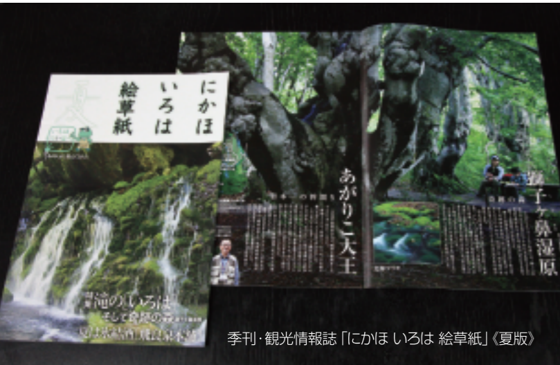
季刊・観光情報誌「にかほいろは 絵草紙」《夏版》