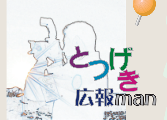
『とつげき広報man』では、広報担当が取材・撮影した写真とコメントをお伝えしていきます！