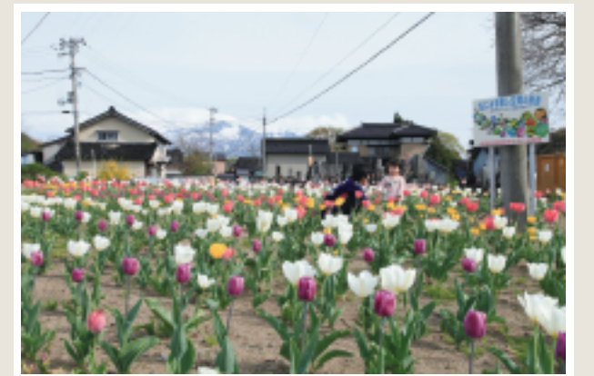
長岡集落・温故会のみなさんが植えられたチューリップです。5月の大型連休中、多くの家族連れが車を停めて、楽しんでいました♪ (な)

企画・編集／にかほ市広報委員会 発行／にかほ市役所 〒018-0192 秋田県にかほ市象潟町字浜ノ田1番地