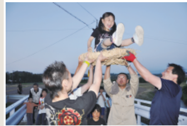
赤石地区の子ども行事・菖蒲蓬です。子ども達の身体堅固を願い、胸上げ。喜ぶ子、怖がる子、さまざまな表情をパチリ！ (た)

七高神社を遷座する際に、三社殿も移築しており、現在の三社殿には、堂庭時代の古材がかなり使われています。そのため、中世建築の面影が見られ、たいへん貴重な建造物となっています。