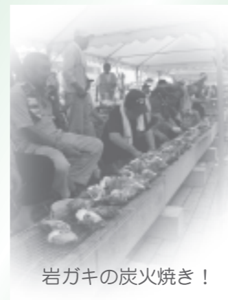
岩ガキの炭火焼き!