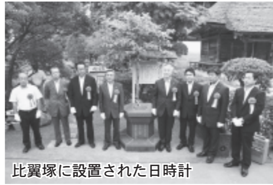
比翼塚に設置された日時計

また、今後も夫婦町として固い絆とともに時を刻んでいきたいとの願いを込めた「日時計」が設置し、その除幕式も併せて行われました。