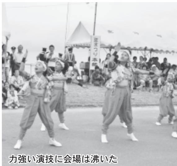
力強い演技に会場は沸いた

8月16日、にかほ夏祭りが象潟海水浴場を会場に行われ、延べ52,000人の観客が詰めかけました。日中のイベントにはブラウブリッツ秋田の選手も参加し、子どもたちとPK対決などを行う等、会場を沸かせてくれました。また、海水浴場監視塔前の特設ステージではダンスチームによる演技が披露され、各チームの躍動感あふれる踊りに観客からは多くの拍手が起こっていました。午後7時からは、同会場で第64回花火フェスティバルが行われ、約5,000発の花火が夏の夜空を彩りました。花火の合間には秋田竿燈会による竿燈の妙技も披露され、間近でみる伝統の技や、大きく傾いた竿燈に歓声が上がっていました。花火フェスティバルのフィナーレは、目玉全長350mのナイアガラ花火。他には類を見ない花火に火が灯ると、その幻想的な光景に観客たちは魅了されていました。