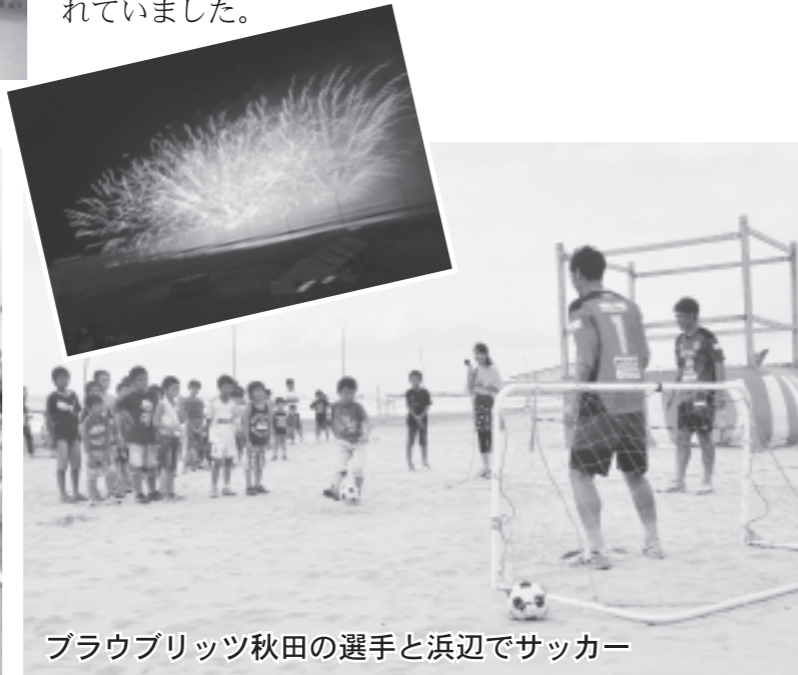
ブラウブリッツ秋田の選手と浜辺でサッカー