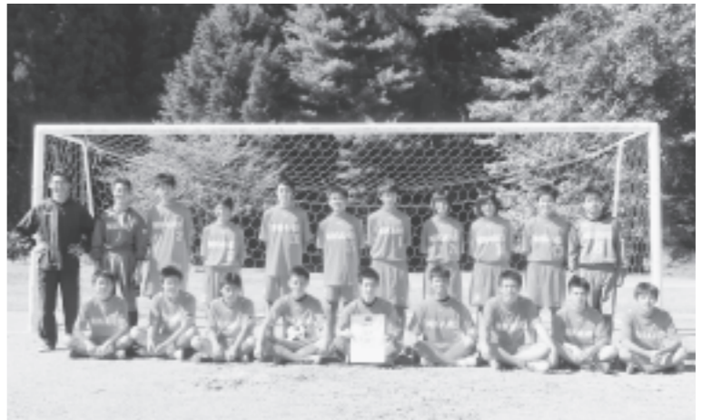
2年連続の優勝を果たした仁賀保中サッカー部