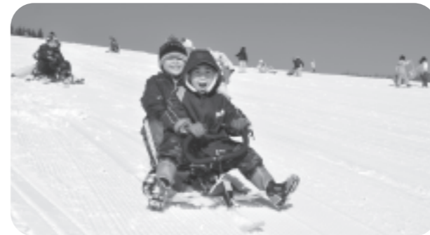
晴天となり最高のコンディション!