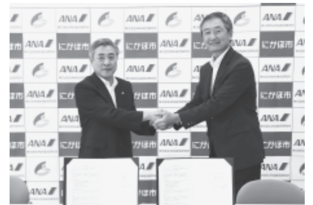
観光振興により地域活性化を図ります

昨年10月に立ち上げたにかほ市観光振興プロジェクトチームの提案した「観光事業」が、3月、観光庁が公募した「魅力ある観光地づくり事業」に選ばれました。ANA総合研究所がそのコンサルタントに決定したことを縁とし、この事業が終了する25年度以降も、地域活性化に向け協働していくとしたものです。長瀬社長は、「にかほ市のポテンシャルは非常に高い。それを具体化するアイデアを提案していきたい」と話しました。