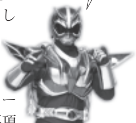
元祖！秋田のヒーロー「超神ネイガー」