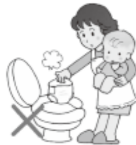
おむつ、 生理用品等の水に溶けないごみ