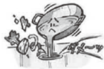
天ぷら油などの大量の油