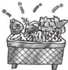
生ごみ等の固形物