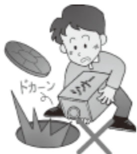
灯油、シンナー等の危険物