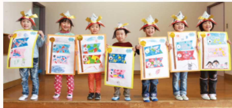
作品名：大空に泳ぐ鯉のぼり