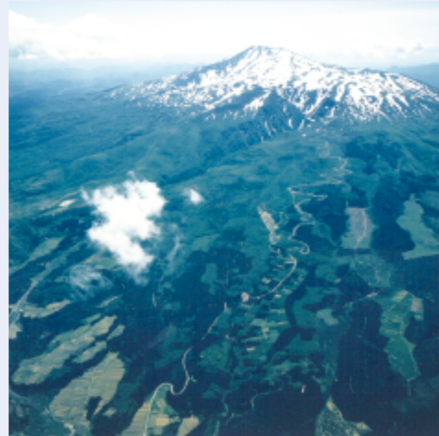
霊峰鳥海山の歴史等にかかわる資料を展示