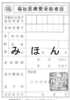
▶福祉医療費受給者証

福祉医療費受給者のうち、受給者証の有効期間が平成26年7月31日までとなっている方