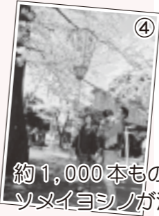
④ 約1,000本ものソメイヨシノが満開