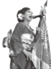
⑥ 133人が古くから歌い継がれてきた草刈唄を熱唱。