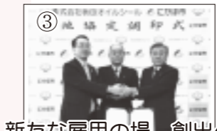
③ 新たな雇用の場、創出へ