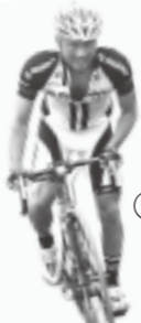
⑦ 標高差1,000mの難コースを自転車で一気に駆け上がる。