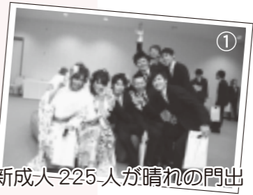
① 新成人225人が晴れの門出

今年も残すところあとわずか。国内において大きな話題といえば、消費税の増税やサッカーワールドカップブラジル大会で日本代表の健闘などが思い出されますが、にかほ市では、どのような年だったか、2014年を振り返ってみましょう。