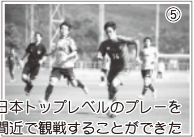
⑤ 日本トップレベルのプレーを間近で観戦することができた