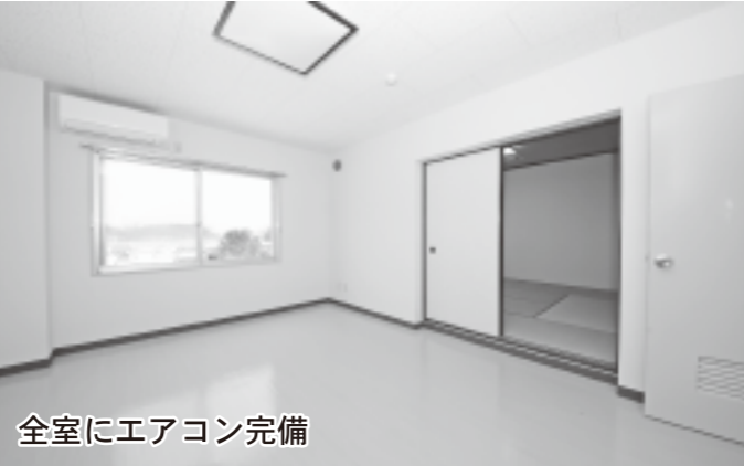
全室にエアコン完備