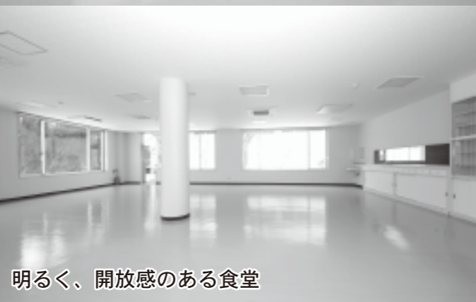
明るく、開放感のある食堂