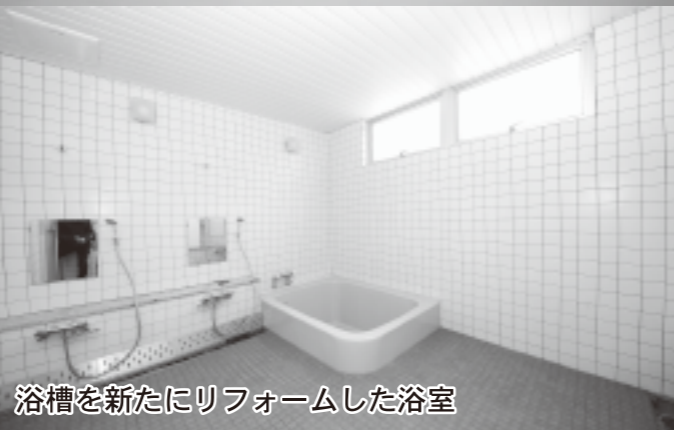
浴槽を新たにリフォームした浴室