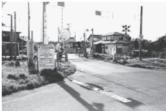
羽越本線小滝踏切