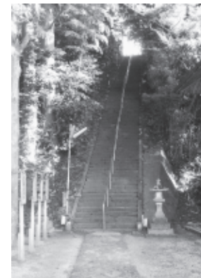
大物忌神社吹浦口之宮

鳥海山は、60万年もの長い間に、何千回もの噴火が繰り返された。噴火の際、溶岩が流れ出し、溶岩が重なりあがり、それが鳥海山を形成した。噴火の際、溶岩が流れ出し、溶岩が重なりあがり、それが鳥海山を形成した。噴火の際、溶岩が流れ出し、溶岩が重なりあがり、それが鳥海山を形成した。