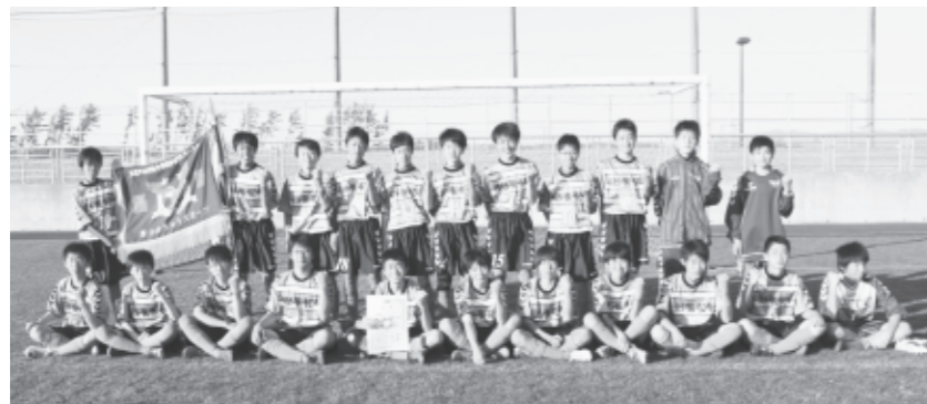
▲象潟中サッカー部

【準優勝】 バスケットボール女子（仁賀保中） ソフトテニス男子団体（象潟中） 【第3位】 野球（仁賀保中）