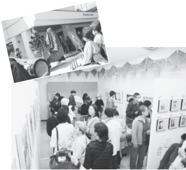
木版画の魅力を十分に満喫！

町そのものが池田修三美術館であり、暮らす人々が学芸員として旅人をおもてなしするという、まちぐるみ美術館プロジェクトは5月24日まで行われます。