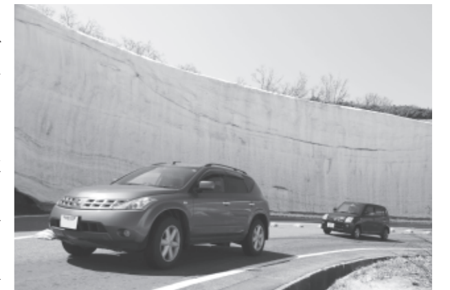
パレードする車両、雪の回廊を楽しむ

今年は、例年より積雪が少なく毎年10mを超える「雪の回廊」も7mほどとなりませんが、間近で見る壁の迫力に圧倒されました。なお、当路線は路面凍結による事故防止のため5月下旬まで、夜間通行止めとなります。