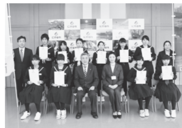
ジュニア観光大使、1人でも多くの人に伝えたい！

生徒たちは、修学旅行での自主研修を活用し、宿泊先のホテルや秋田県のアンテナショップで当市のPRや観光パンフレットの配布などを行います。