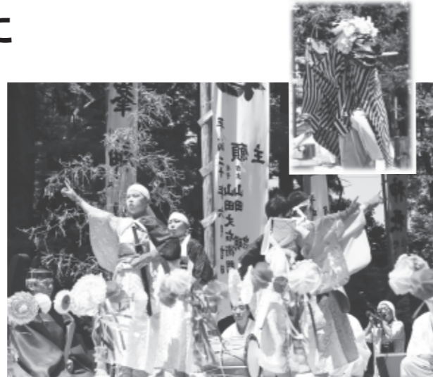
1200年の伝統を胸に舞う

例年、6月第2土曜日に行われていたチョウクライロ舞ですが、少子化が進み子供たちの部活動との両立が難しくなるなか、それでも伝統を守り伝えていこうと、今年から5月最終土曜日に行くことになりました。