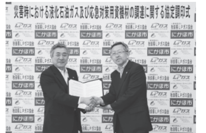
災害時、避難所などの環境改善に期待

避難所などの過酷な環境のなかでは、燃料や発電設備には複数の手段を用いた準備が必要となるため、今回のLPガス関連の資機材提供に関する協定は心強く、避難所などの環境が格段に良くなることが期待されます。