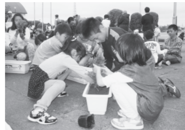
みんなで協力、花を植える児童たち

植栽式で、校長先生と人権擁護委員協議会会長による人権についてのお話を聞いた後、上級生が下級生に手伝いながらプランターに花を植えました。植え終えたプランターは玄関前に並べられ、児童たちは花がいつまでも咲き続けるようお願いを込めながら水をあげていました。