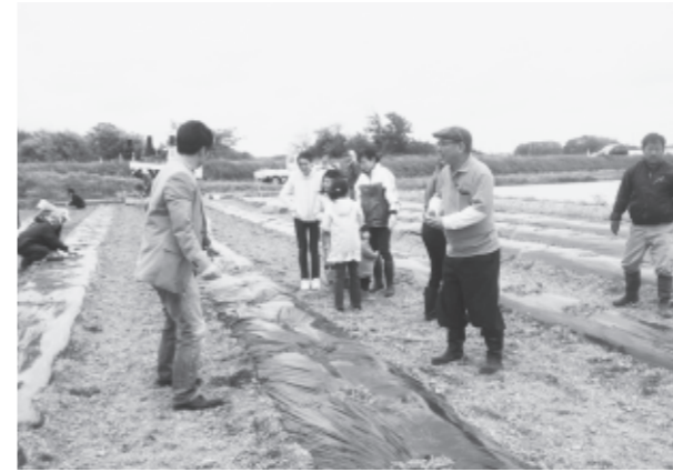
苗の植え方を確認しながら作業を進めた