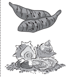
イラストはイメージです