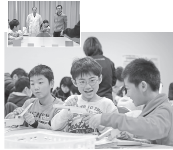
上手にできたかな？