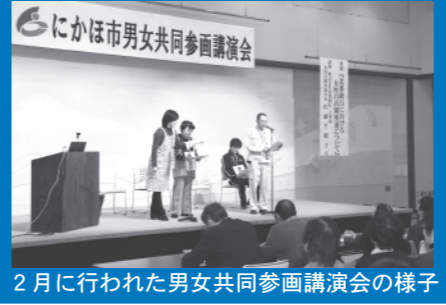
2月に行われた男女共同参画講演会の様子