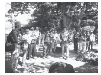
ジオガイドの役割はジオサイトを案内することなんだね。

伊 象潟町の蚌満寺や九十九島、特に多いのが中島台の獅子ヶ鼻湿原ですね。にかほ市には身近なところの良いところがたくさんありますよ！