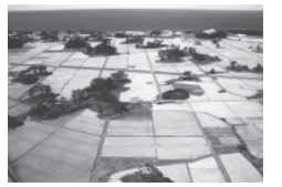
天然記念物「九十九島」

伊 九十九島と上郷温泉路が好きですね。特に九十九島は鳥海山と深い関わりがある。その歴史がとても好きです。