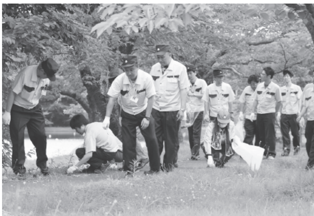
南極公園を清掃しながらウォーキングする社員

7月27日、南極公園周辺を会場にTDK鳥海・稲倉工場の社員98人による「クリーンウォーキング」と題した清掃活動が行われました。これは同社が地域貢献と健康増進を目的に毎年開催しているもので、今年も暑い中、社員らは黙々と作業を繰り返しました。「今年は比較のごみが少ない」と話す社員もいましたが、終わってみれば多くのごみが集められました。8月5日には同社秋田工場の社員370人が工場周辺を清掃作業しながらも、健康増進を兼ねたウォーキングで汗を流しました。