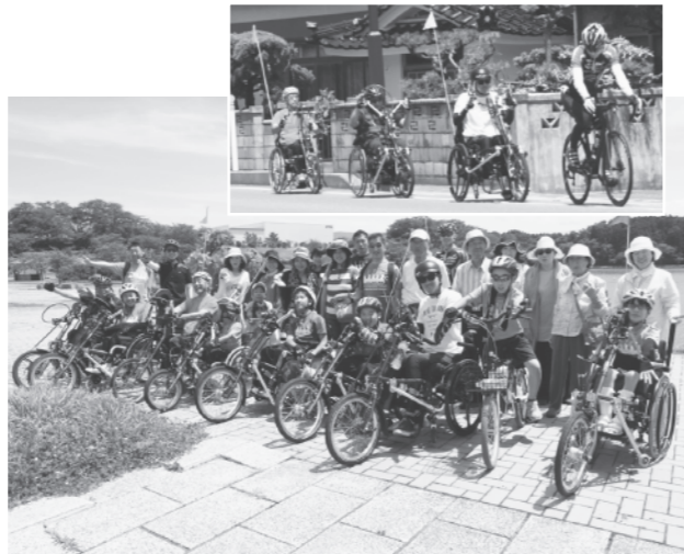
南極公園での集合写真「安全第一で楽しみます！」

ハンドバイクは自転車と同じく、普段は見落としがちな景色を楽しめる魅力があります。また、車椅子への後付けも可能なうえ、三輪の専用車もあることから多くの方が自分のペースで楽しめる自転車として注目されています。