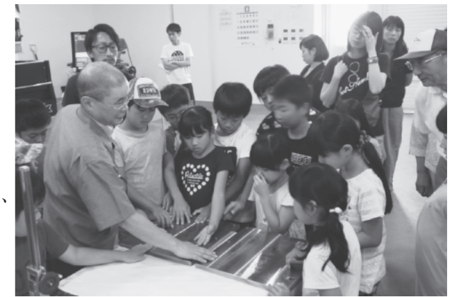
実際に手で触れながら職場の様子を見学！

見学会は、子どもたちが地元のさまざまな職場を見学し理解を深め、地域産業やものづくりへの関心を高めることを目的として開催されました。