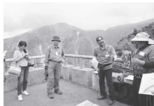
ジオガイドによる奈曾溪谷の説明（鉾立展望台にて）

鳥海山・飛島ジオパーク構想の日本ジオパーク認定申請に伴う現地審査が8月13日から3日間の日程で行われ、構成する4市町の見どころや取り組み状況などを3人の審査員が確認しました。