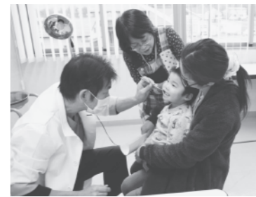
3歳児歯科健診の様子

12月4日、「第16回秋田県歯科保健大会」が開催され、にかほ市が子どもたちの歯の健康のために取り組んでいる歯科保健事業やフッ化物洗口事業が、他の模範となる歯科保健活動として評価され、臼井記念歯科保健功労表彰を受けました。