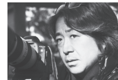
写真家・宮澤正明氏

日本人の心と暮らしの原型を「伊勢神宮」に見出した写真家・宮澤正明氏が語る、私たちの未来に繋いでくれるものを、ぜひ感じてみてください。